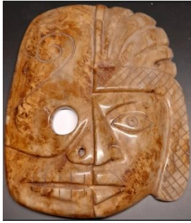
Ritueel masker van Quetzalcoatl, oppergod uit de Azteekse mythologie.

In 1753 heeft de Zweedse wetenschapper Linnæus de cacao boon de naam 'Theobroma cacao' gegeven. De letterlijk vertaling ervan is: 'CACAO, HET VOEDSEL VAN DE GODEN'.