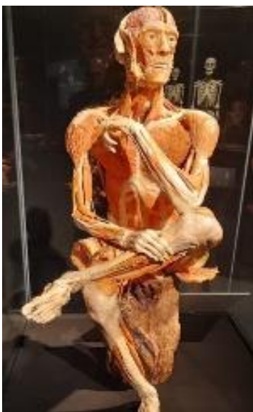
'De Denker Binnenste Buiten' – gecreëerd door dr. Gunther von Hagens.

Al geruime tijd zijn er transplantaties (voorbeeld: eerste ingreep voor het hart: 1967 dr. Barnard Zuid-Afrika) en doelgerichte ingrepen, zoals heup- en knieprothesen. Meer dan 20.000 donoren hebben reeds hun lichaam nagelaten. Wat brengt de toekomst? Worden de geplastineerde lichamen gerecycleerd? Plaats men er de organen en bloedbanen op de juiste plaats? Worden er in de hersenen 'chips' met 'Artificiële Intelligentie' geplaatst, gevolgd door automatische updates? Zal ik mij laten plastineren? Wie dan leeft, zal dan zien...Ajuus!