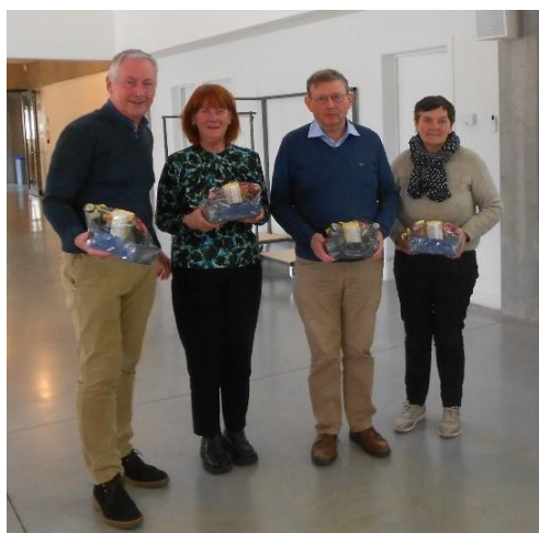
De Drie Wijzen